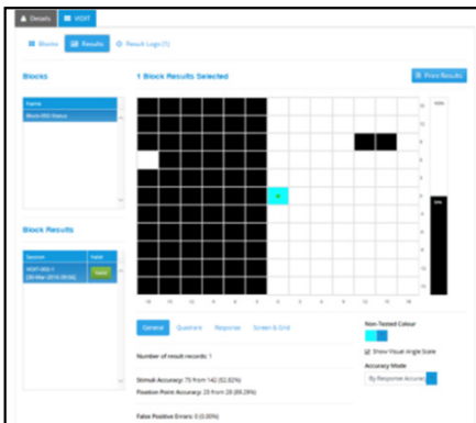
VIDIT - Ergebnisbericht Gesichtsfeldtest