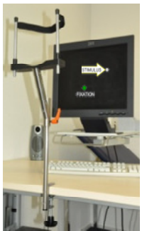
PC Arbeitsplatz mit Kinnstütze