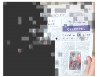
vor VRT Gesichtsfeldausfall links