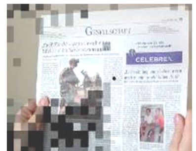
nach VRT verbesserte Sehfunktionen